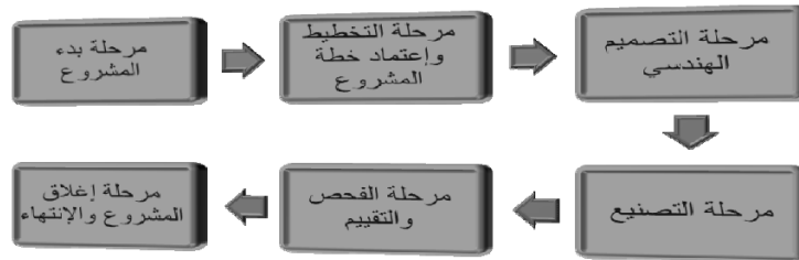
شكل رقم (1): المراحل الستة لدورة الحياة الهندسية لمشاريع التصميم والتطوير العسكرية